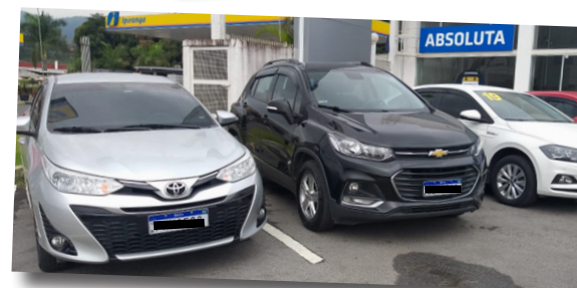
Linha de usados revisados e com garantia

e empresários também tem seu lugar na Absoluta que vende veículos para PJ (Pessoa Jurídica). Em todos os casos, a Concessionária dispõe de pessoal especializado, treinado e apto a realizar os atendimentos em quaisquer itens oferecidos.