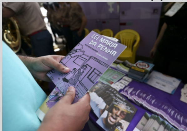
Regra passa a valer após alteração na Lei Maria da Penha

Conforme as alterações, as medidas protetivas de urgência devem ser