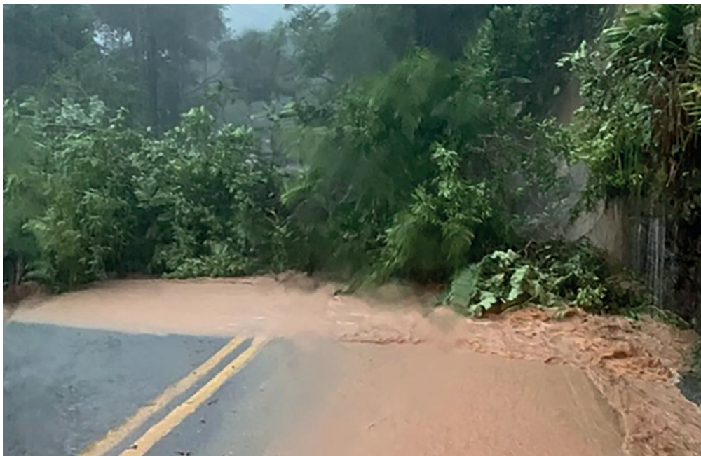
Deslizamento de terra provocou fechamento de várias estradas dificultando o socorro