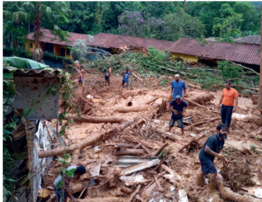
Nos locais onde se pode chegar, o socorro foi importante para resgatar vidas

As chuvas torrenciais que estão caindo diariamente em todo Estado, castigaram o Litoral Norte de São Paulo com muitas vítimas em vários municípios daquela região, alguns com decreto de Calamidade Pública.