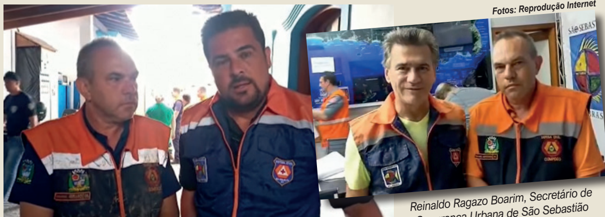
Soninho ao lado do prefeito de São Sebastião, Felipe Augusto

Caieiras envia equipe da Defesa Civil a São Sebastião para apoiar nas buscas por desaparecidos, após temporal que deixou estragos no litoral de São Paulo. Um vídeo gravado por Reinaldo Ragazo Boarim, Secretário de