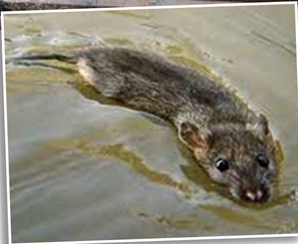
A leptospirose é uma doença infecciosa febril aguda que é transmitida a partir da urina (principalmente de ratos) por meio de água infectada pela bactéria Leptospira

A leptospirose é uma doença infecciosa causada por bactérias e pode ser transmitida por meio do contato com água ou solo contaminado com urina de animais infectados, como roedores, cães e bovinos. A leptospirose pode causar complicações graves como insuficiência renal, hepática, pulmonar e até mesmo a morte.