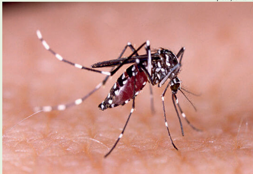
A Dengue é uma doença de periodicidade sazonal e se destaca pelas dores no corpo

A dengue é uma doença infecciosa causada pelo vírus da dengue, transmitida pelo mosquito Aedes aegypti . Os sintomas incluem febre alta, dores de cabeça, dores nas articulações, manchas vermelhas na pele e fadiga. Em casos graves, a dengue pode levar à dengue hemorrágica, que é uma condição perigosa que pode ser fatal.