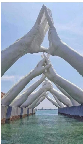
Esta é a escultura chamada